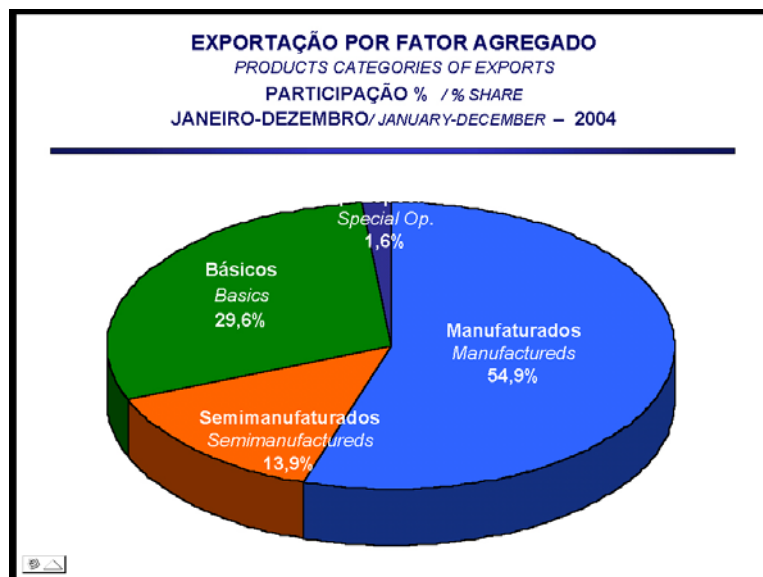
Grafik 1: Brasiliens Export nach Kategorien

Von den brasilianischen Gesamtexporten in Höhe von 96,475 Mrd.US-$. im Jahr 2004 entfielen 54,9 Prozent auf verarbeitete Produkte, 13,9 Prozent auf halbverarbeitete Produkte und 29,6 Prozent auf unverarbeitete Produkte: